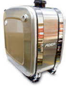
TSBE DEPOSITO OLEO LATERAL EM ALUMINIO C/CINTAS