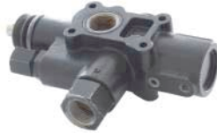
VVLV VALVULA PARA BASCULA