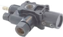
DTCA DISTRIBUIDOR PARA BASCULA