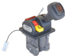
60.BZ126N COMANDO PARA BÁSCULA